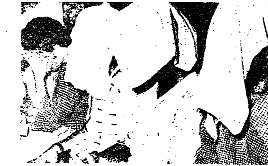
عدد من أفراد « جماعة التكفير والهجرة » وقد دعوتهم لاجتماعهم في دمشق

الدين في جوهره الحقيقي هو الاعتناء الى وجود تلك القوة المعنوية الهائلة على الحياة والكون ، وهو الله ، والجهان به ، وعيادته باليمن قبل الشمار . وجمعة رجال الدين ، او فقهاء الدين ، هي تسهيل الاعتناء الى الله وعبادته . ولا يزال السؤال الحائر : لماذا قتل الجماعة الدكتور الذهبي ؟ اعتقد ان دواعف قتل الدكتور الذهبي لا تعرف حتى الان ، ومن غير المنطقي ان يكون اغتياله نتيجة لتكادله المهادية للجباية لسبب بسيط جدا هو ان الدكتور الذهبي كان له رأي في الجماعة .. يقول « ... اغلب الظن ان هذه الجماعة ليست الا غلة من الشباب ينشد الدين في ايامهم وبعدها عن مظاهر فساد الخلق وانحراف السوك .